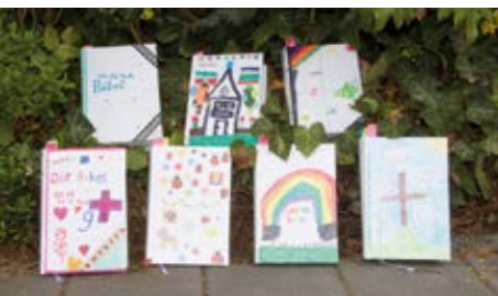
Bibeln der KFK Kinder, die sie selber verziert haben

den wöchentlichen Stunden vermittelt werden, ist Gemeinschaft ganz wichtig. Diese wird oft durch Übernachtungen im Gemeindehaus Bühl bzw. Freizeiten wie das Konficastle intensiviert. Die Hoffnung ist, dass mit der Konfirmation die Jugendlichen nicht „fertig“ sind, sondern sie dann schon