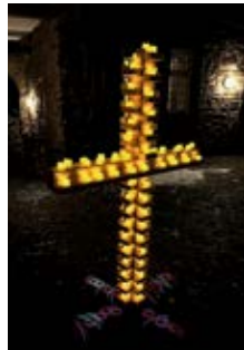
Lichtkreuz am Konficastle 2023 ein Ort, um Glauben festzumachen

In dieser Ausgabe würde ich gerne einen kurzen Einblick in unsere Konfirmandenarbeit geben. Eine der großen Neuerungen, als Pfarrer Brinken seinen Dienst vor über 30 Jahren in unserer Gemeinde angetreten hat, war die Umstellung der Konfirmandenarbeit. Klassisch findet der Konfirmandenunterricht ja im 7. und 8. Schuljahr statt. Seit 30 Jahren wird in Betzdorf das erste Jahr aber schon im 3. Schuljahr als Kirche für Kinder (KFK) angeboten, weil die Begeigerungsfähigkeit in diesem Alter wesentlich höher ist. Von Herbst bis zum Frühjahr kommen die Kinder wöchentlich zur KFK Stunde, wo mit viel Erlebnissen die ersten Grundlagen im Glauben gelegt werden. Nach der Abschlussübernachtung finden die Kinder danach im Idealfall eine Heimat in den Angeboten der Jugendarbeit, die wir mit dem CVJM zusammen anbieten (Jungscharen, Kinderchor, Teenkreis, Freizeiten usw.). Im 8. Schuljahr erleben die Jugendlichen dann das zweite Konfirmandenjahr (KU-8). Neben den „normalen“ Inhalten wie Glaube, Gebet, Bibel, Gemeinde usw., die in