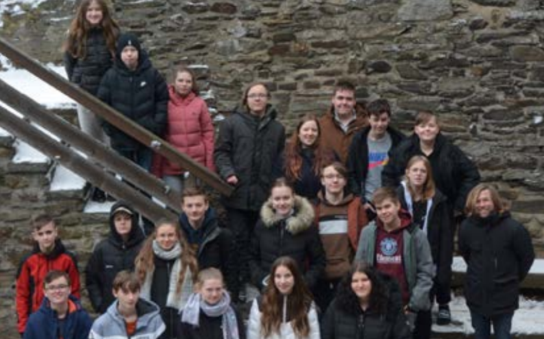
Teilnehmende aus Betzdorf beim Konficastle 2023 auf der Freusburg

den wöchentlichen Stunden vermittelt werden, ist Gemeinschaft ganz wichtig. Diese wird oft durch Übernachtungen im Gemeindehaus Bühl bzw. Freizeiten wie das Konficastle intensiviert. Die Hoffnung ist, dass mit der Konfirmation die Jugendlichen nicht „fertig“ sind, sondern sie dann schon